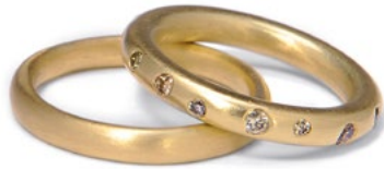
EHERINGE EXKLUSIV 585er Gelbgold, Halb-Oval-Profil Strichmatt, farbige Brillanten