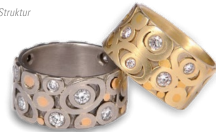
EHERINGE EXKLUSIV Weissgold mit Feingold, Ösen-Muster, Brillanten (links) 585er Gelbgold mit Feingold, Ösen-Muster, Brillanten (rechts)