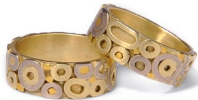
EHERINGE EXKLUSIV 750er Gelbgold mit Weissgold, Flach-Profil mit Ösen-Struktur