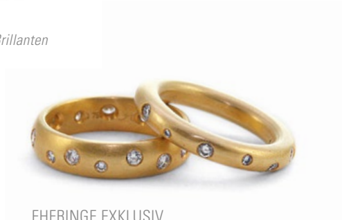
EHERINGE EXKLUSIV 585er Gelbgold, Halb-Oval-Profil Strichmatt, Brillanten (links) 585er Gelbgold, Rund-Profil Strichmatt, Brillanten (rechts)