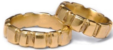
EHERINGE EXKLUSIV 750er Gelbgold, Flach-Profil mit vertikaler Struktur